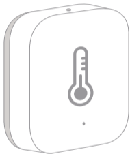
Temperature and Humidity Sensor